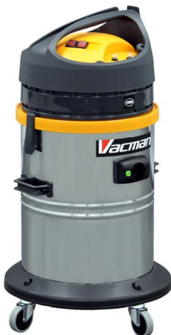
W12N および W22N