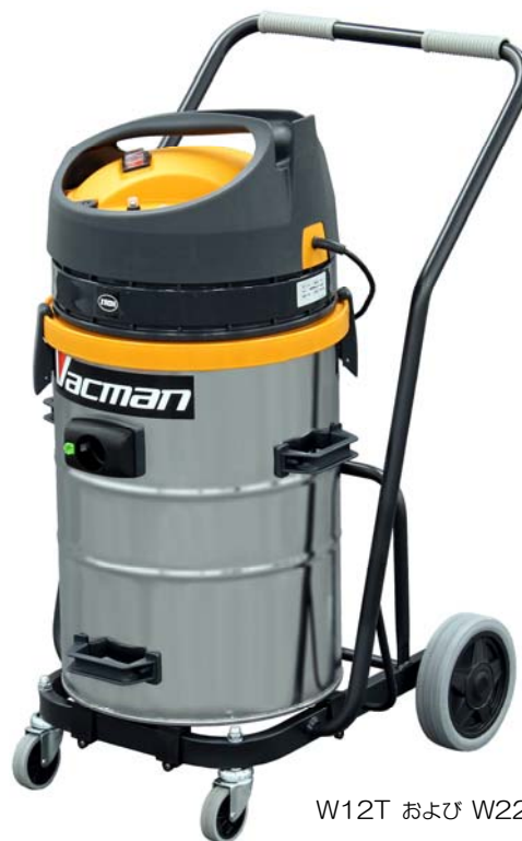
W12T および W22T