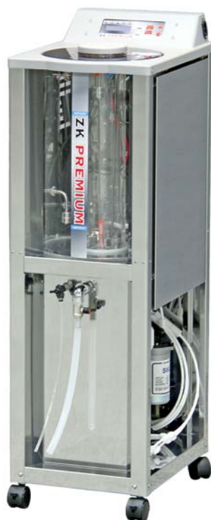
スタンダードタイプ ZKプレミアム