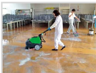
▲ワックス床の洗浄や剥離作業に