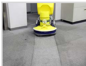
▲カーペット洗浄に