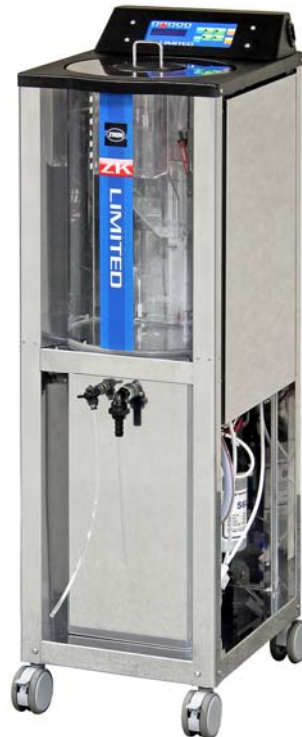
自動生成タイプ ZKリミテッド